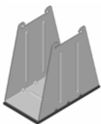
1 x hohe Mittelstütze

Unsere Alpin Lösung setzt sich aus folgenden Bauteilen zusammen: