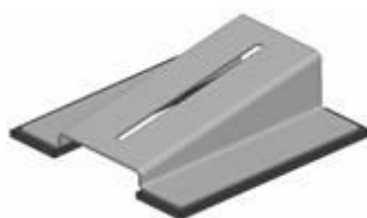
2 x niedrige Mittelstütze