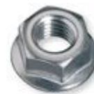
2 x Flanschmutter (für niedrige Alpin-Stütze)

(2 x Endklemme analog PV-Modul müssen separat dazu bestellt werden)